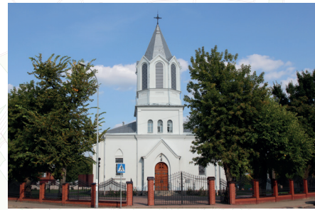
1. Kościół Najświętszego Serca Jezusa, ul. Traugutta 25

Metalowe kartusze z niebieskim motywem, opisy w języku polskim i angielskim.