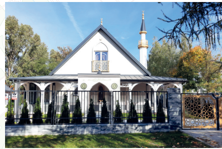
3. Muzułmański Dom Modlitw, Dom Kultury Muzułmańskiej, ul. Piastowska 13 F

Parafia została powołana dn. 02.10.1987 r. Kościół wg projektu inż. arch. Jerzego Zgliczyńskiego został zbudowany w latach 1990-96. Jego bryła nawiązuje do architektury kościoła św. Rocha. Wnętrze kościoła zdobią obrazy Marka Karpa. W dolnym kościele odprawiane są msze w obrzędzie łacińskim i bizantyjsko-ukraińskim. Tu również mieści się Muzeum Sybiraków. W 1998 r. powstał pomnik Nieznanego Sybiraka autorstwa Dymitra Grozdewa.