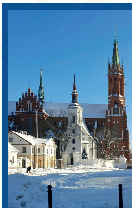
5. Zespół katedralny Wniebowzięcia Najświętszej Marii Panny, ul. Kościelna 2