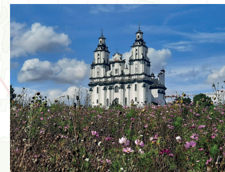
10. Kościół Zmartwychwstania Pańskiego, ul. ks. arcybiskupa Romualda Jałbrzykowskiego 5